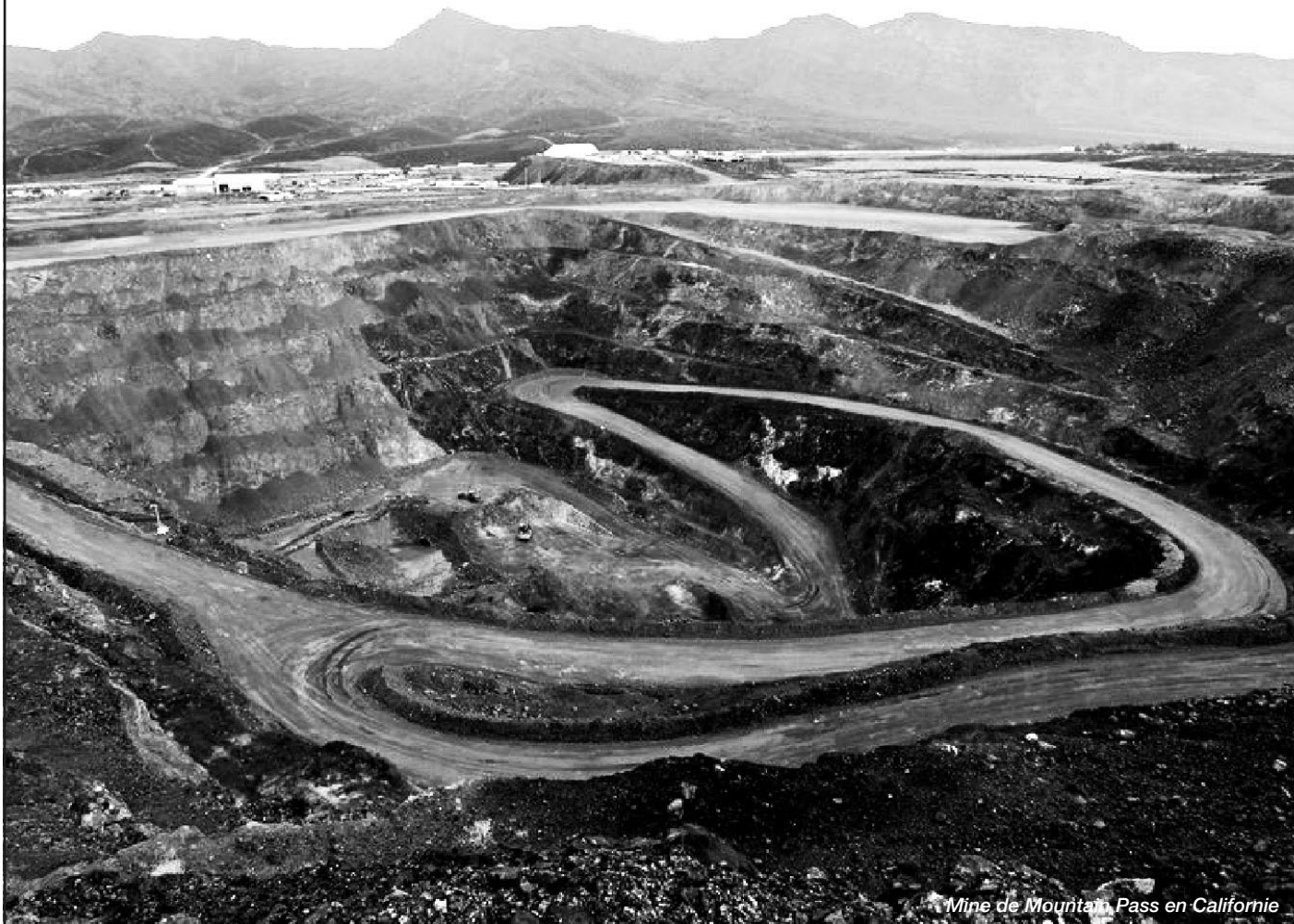
Mine de Mountain Pass en Californie

Guillaume PITRON, Serge TURQUIER France documentaire 2012 55mn